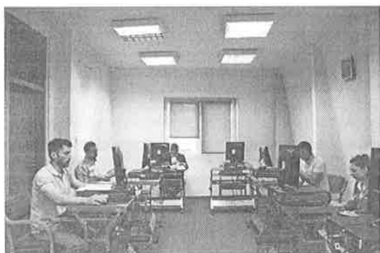
Research Hall 1