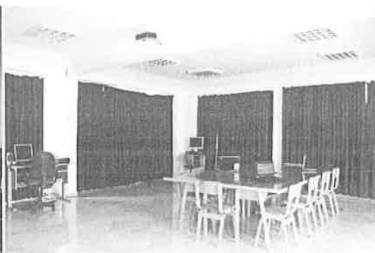
Research Hall 2